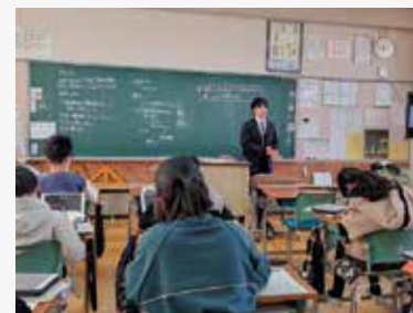
教職大学院生による公立学校での実習