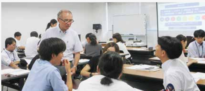
教育評価研修会「OPPA」（辻本講師によるグループワーク）

教員育成推進部門は、教職を志す学生と現職教員のキャリアステージに応じた学びや成長を支えます。また、山梨県内の教員養成の中核大学として、意欲と実践力の高い教員の養成、研修・研究の企画・実施、教育課程の開発等、教育現場の様々な活動を支援します。