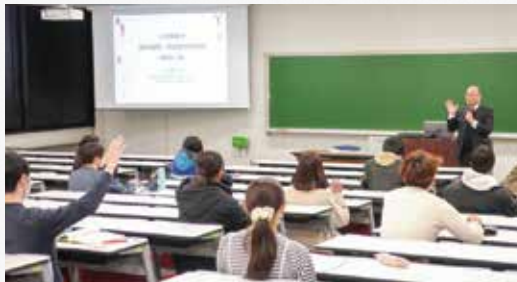
4日間集中 教員採用一次試験対策講座