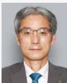
山梨県教育委員会 教育長

センターは、引き続き山梨県の教育の未来のため、さらなる充実を図っていきたくと考えています。今後ともご支援・ご指導を賜りますようよろしくお願いいたします。