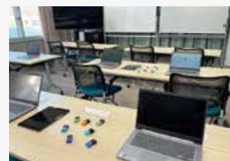
情報教育研究開発室