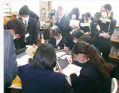
附属中学校公開研究会