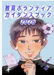
教育ボランティア ガイダンスブック