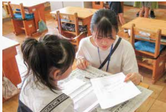
授業支援ボランティア