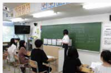
模擬授業室活用風景