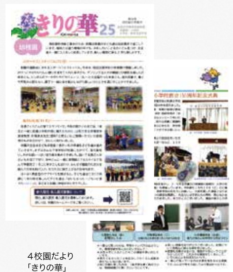
4校園だより「きりの華」