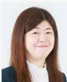
山梨大学 教育学部長