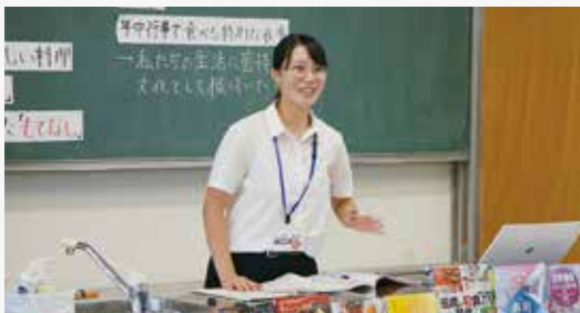
附属中学校での教育実習