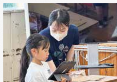
「ICT支援学生」の養成・附属学校への派遣