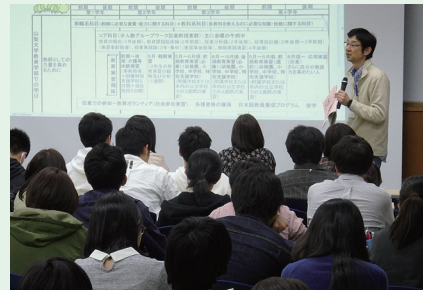
新入生合宿研修(教育学部での学びの紹介の様子)