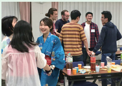
異文化交流(国際交流会における日本文化体験)