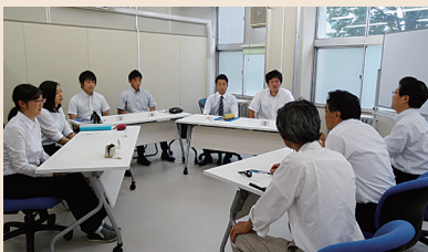
就職支援室：集団討論の指導の様子