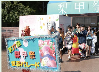
大学祭(仮装パレードの様子)