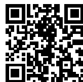
相談メールアドレスQRコード

連絡先 (e-mail) : kyoiku_soudan@yamanashi.ac.jp メール の 件名 (タイトル) に「相談希望」として、メール本文に氏名及び、連絡先と連絡方法の希望、相談内容を簡単に書いてください。折り返し、連絡を差し上げます。 ※相談メールは、右のQRコードからも送信することができます。