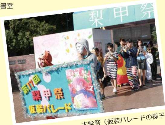
大学祭(仮装パレードの様子)