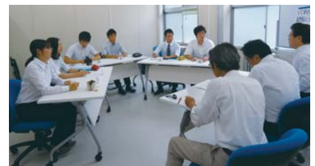
教職支援室：集団討論の指導の様子