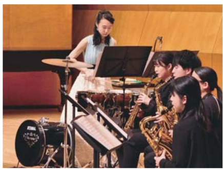
芸術身体教育コース(音楽教育系) 「卒業演奏会」