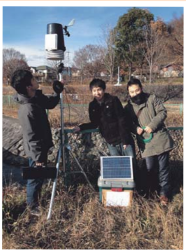
生活社会教育コース(社会科教育系) 「地理分野気象観測」