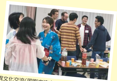
異文化交流(国際交流会における日本文化体験)