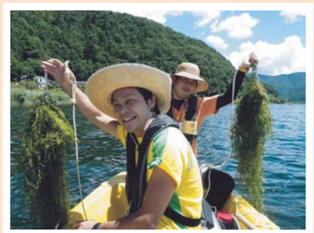
科学教育コース(理科教育系) 「河口湖水草調査」