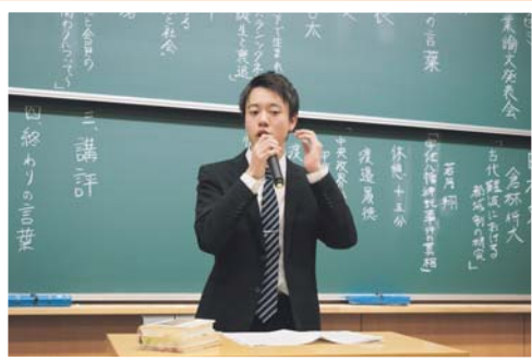
生活社会教育コース(社会科教育系) 「歴史分野卒業論文発表会」