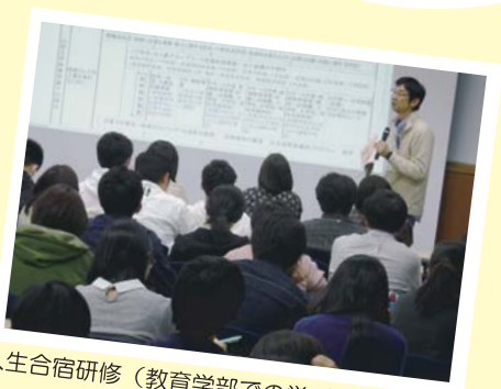
新入生宿研修(教育学部での学びの紹介の様子)