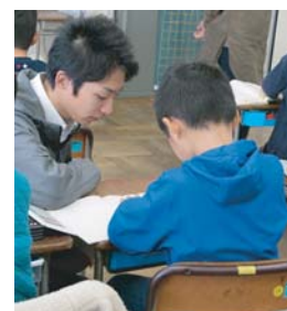
教育ボランティアの様子