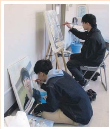
芸術身体教育コース(美術教育系) 「絵画自主制作」